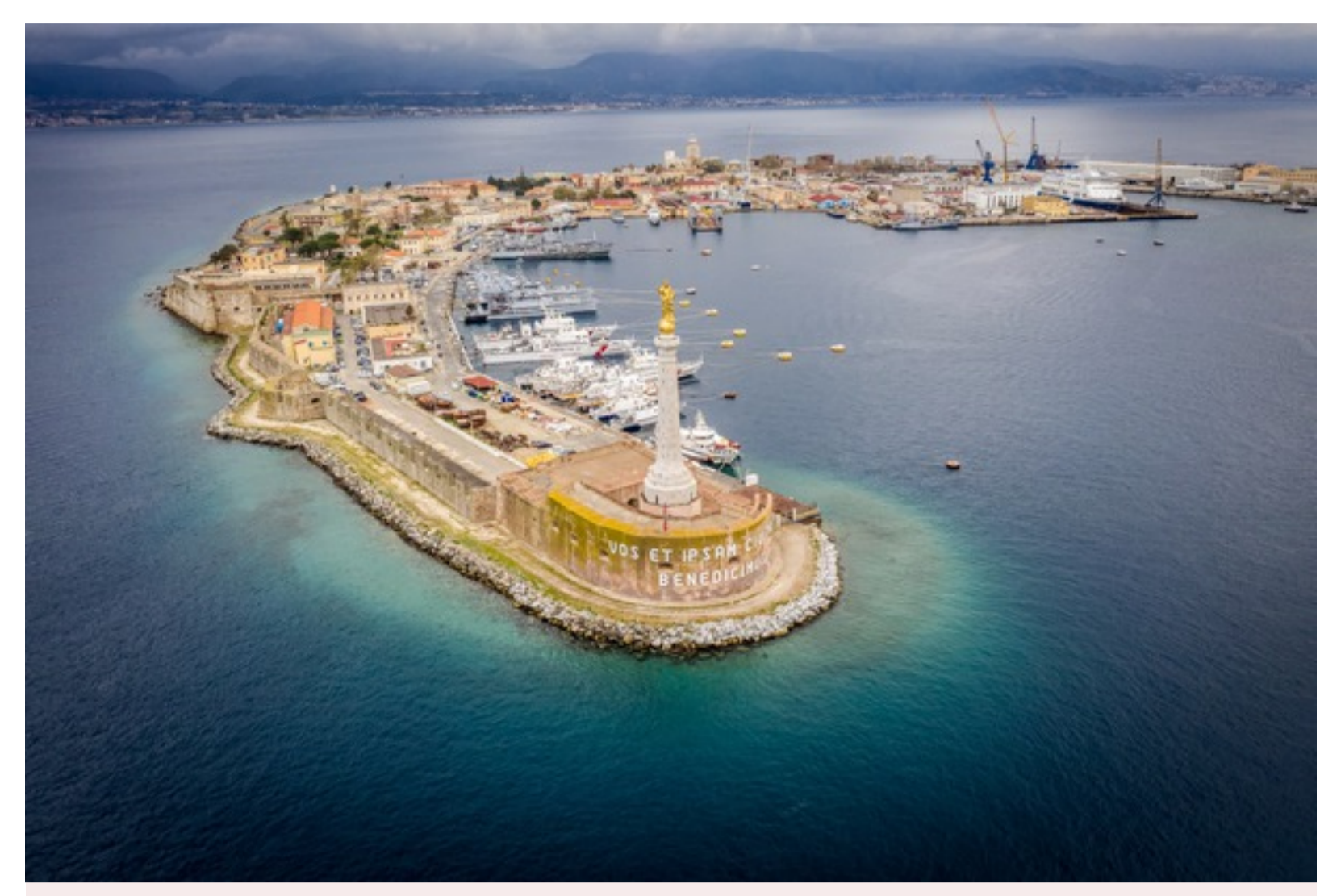
Giornate dei Castelli: il Faro del Montorsoli (proprietà pubblica della Marina Militare, bene mai aperto al pubblico) - RIPRODUZIONE RISERVATA

Di Cinzia Conti ROMA 24 agosto 2021 19:02 | Scrivi alla redazione | Stampa