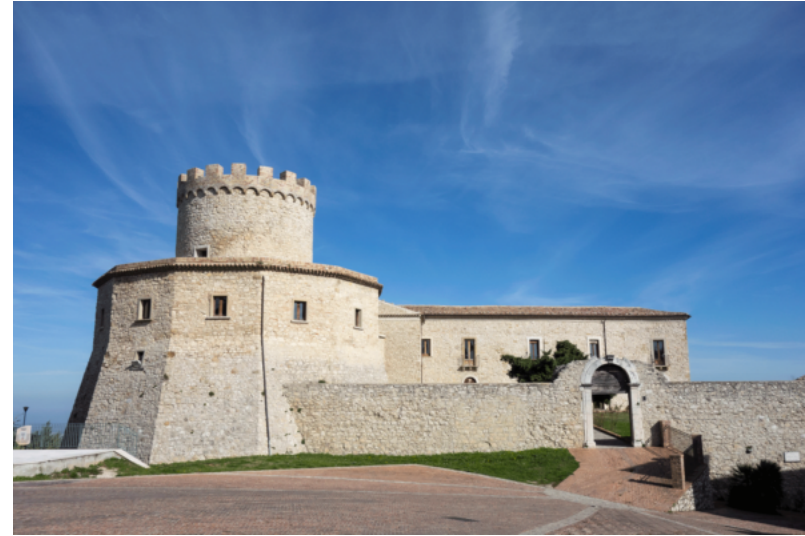
Castello di Palmoli

19 regioni coinvolte per oltre 100 eventi in presenza ed online tra cui: premiere di documentari, visite guidate e walking tour, visite virtuali, conferenze in presenza e streaming, conversazioni, presentazioni di libri, concerti open air, favole e ricerche, degustazioni e pranzi con rivisitazioni storiche.