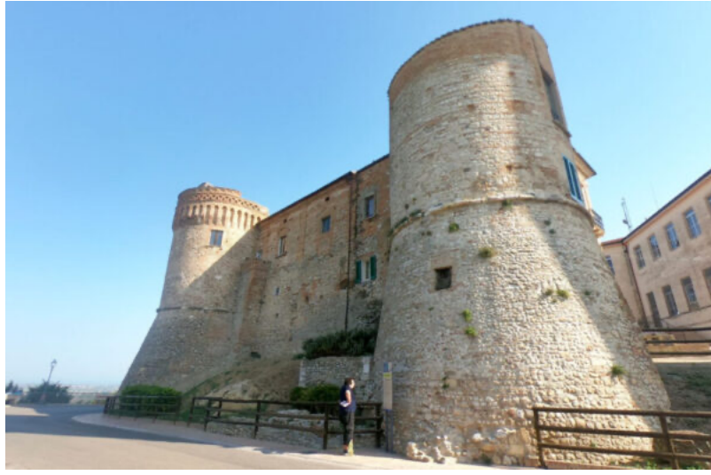
Castello di Montedorisio