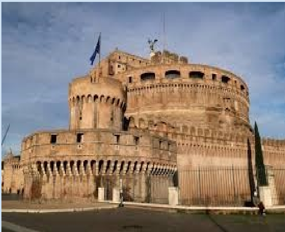
Roma, Castel Sant'Angelo