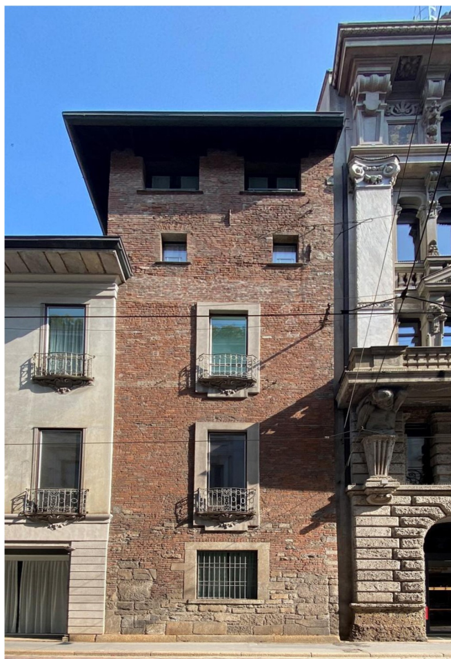
La Torre dei Meravigli a Milano

PUNTO DI RITROVO E ORARI: Piazza dei Mercanti, Milano, 28/09/2024, ore: 10.00-12.00; prenotazione obbligatoria e-mail: castellilombardia.segreteria@gmail.com ; tel. 3209667337