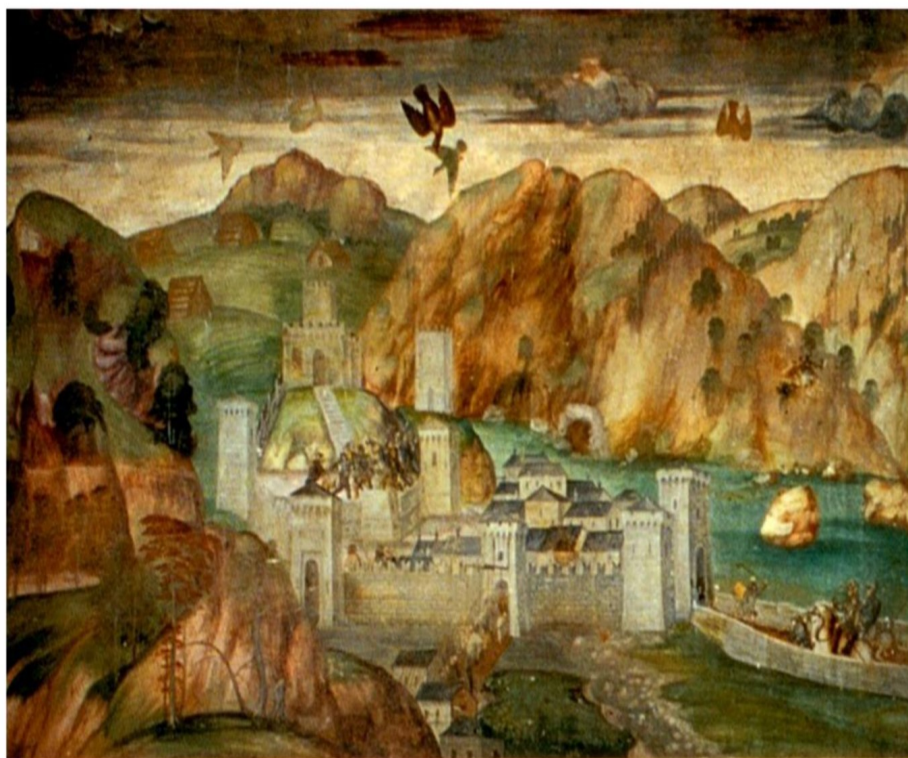
Chiavenna in un affresco del Castello di Melegnano, 1530 ca.

PUNTO DI RITROVO E ORARI: Piazza Don Pietro Bormetti, 3, Chiavenna, davanti alla Collegiata di San Lorenzo, il 28/09/2024 alle 10.00-12.30 e il 29/09/2024 alle 14.30-17.00; prenotazione obbligatoria e-mail: cssvalchiavenna@gmail.com ; tel. 034335382